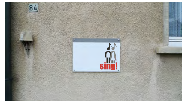
Im Stadtteil Büchenau wurden an verschiedenen Stellen sing! - Infotafeln aufgestellt.